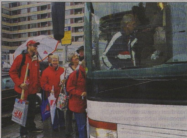
SP'ers en RONA-mensen stappen 's morgens in Velp in de bus.