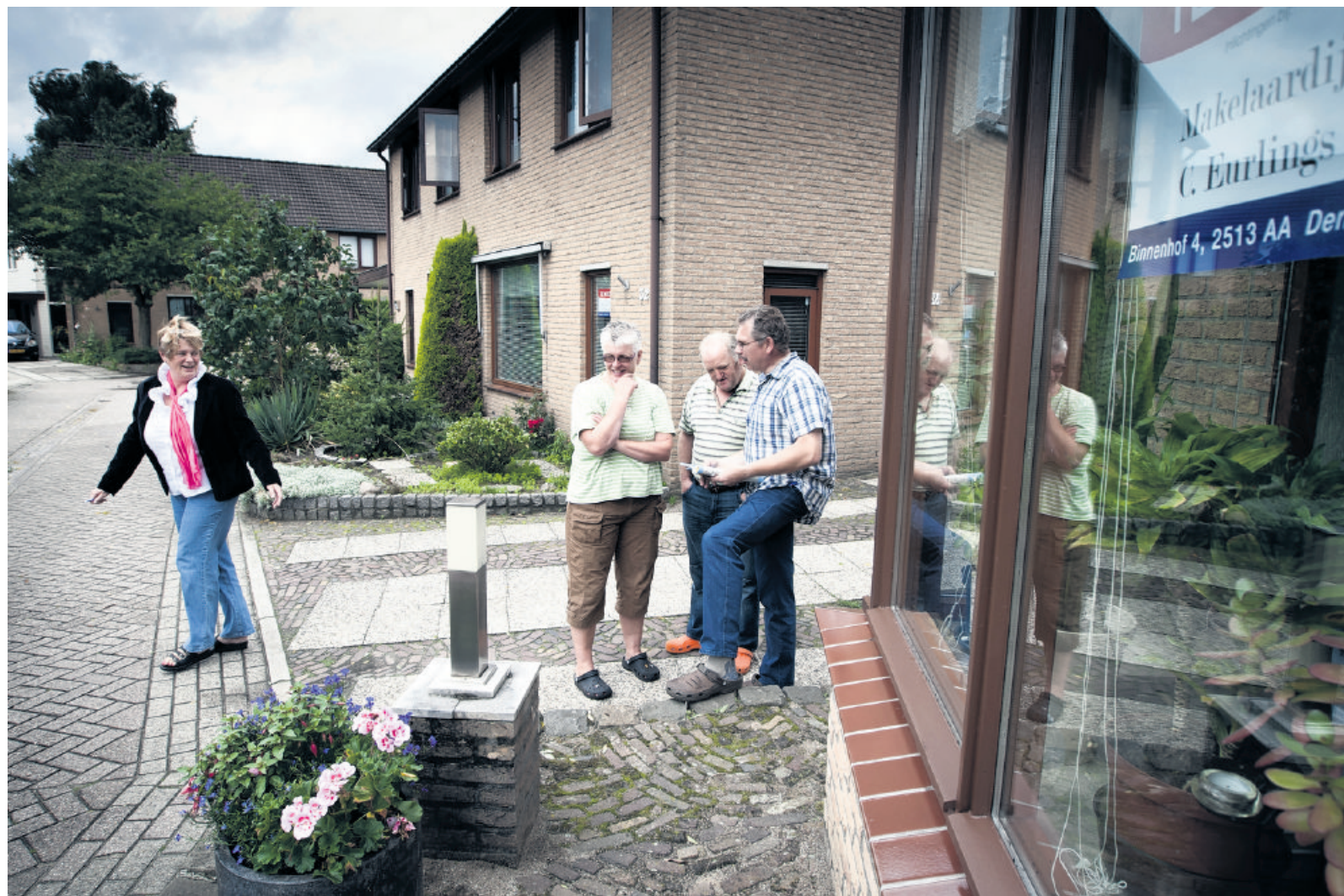
Huizen die moeten wijken voor een spoorbrug zijn door de bewoners 'te koop' gezet. De 'makelaar' is minister Eurlings.